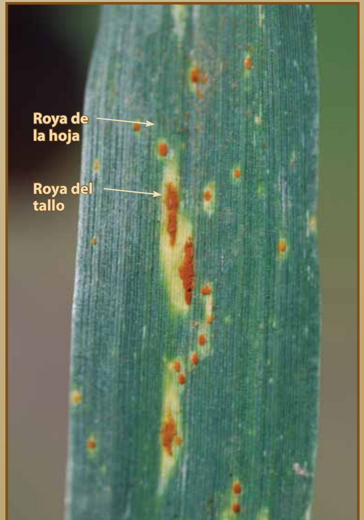
Figura 2. Comparación de las lesiones de la roya del tallo y la roya de la hoja en el tejido de la hoja. Notar que la apariencia en forma de diamante de la roya del tallo es más grande que la de la roya de la hoja.

Diferenciando las royas puede ser difícil, pero con práctica, pueden ser identificadas de forma segura. Empiece considerando las características generales como cual parte de la planta está afectada (Figura 1) o el arreglo de las lesiones de tipo ampolla en el tejido. Estas características frecuentemente pueden rápidamente separar una o más de estas enfermedades. Continúe examinando las características menos obvias incluyendo tamaño de la lesión, forma, y color para bien confirmar el diagnóstico o separar las enfermedades más similares. Por ejemplo, la roya amarilla o rayada es la única de estas enfermedades que tiene las lesiones de tipo ampollas organizadas en rayas o estrías en las hojas (izquierda). Si las lesiones están dispersas en las partes afectadas de las plantas, ambas royas del tallo y de la hoja son una posibilidad y características adicionales tienen que ser consideradas. La roya de la hoja típicamente causa lesiones pequeñas y redondas en las vainas y laminas de las hojas. En comparación, la roya del tallo causa lesiones ovaladas o alargadas y es capaz de infectar casi todas las partes aéreas de la planta, sobre todo los tallos verdaderos (Figura 2).