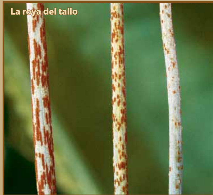
Figura 3. Ejemplos de la variabilidad en síntomas causados por la roya del tallo (abajo), la roya de la hoja (superior derecho), y roya amarilla o rayada (inferior derecho).

Las tres enfermedades tienen interacciones singulares con las variedades más comunes de trigo y cebada. Estas interacciones pueden modificar los síntomas de la enfermedad resultando en la reducción del tamaño de la lesión y variable en la cantidad de tejido amarillo o canela que rodea las lesiones (Figura 3). La familiarización con el rango de posibles síntomas para estas enfermedades mejorará la exactitud del diagnóstico y el manejo de estas enfermedades de importancia económica.