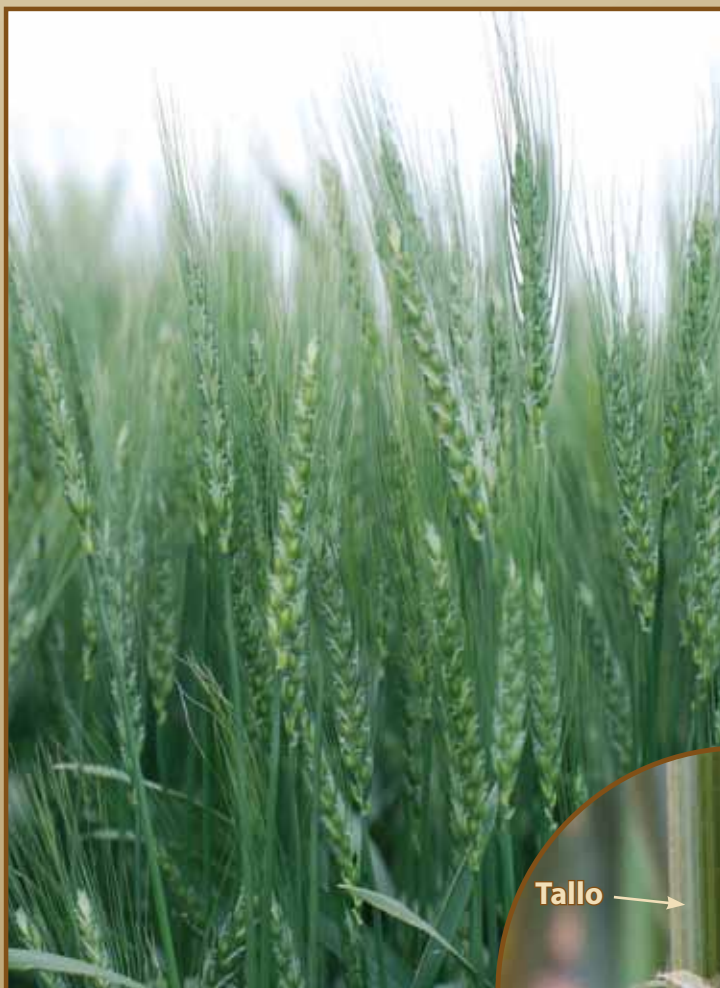
Figura 1. El diagnóstico de las royas requiere de un entendimiento básico de la anatomía vegetal y una revisión rápida de esta información puede mejorar la exactitud del proceso de identificación.

de la susceptibilidad del hospedero y las condiciones climáticas, pero las pérdidas también son influenciadas por la fecha de manifestación y severidad de los brotes de la enfermedad relativos a la etapa de crecimiento del cultivo. Las pérdidas más grandes ocurren cuando una o más de estas enfermedades ocurren antes de la etapa de formación de la espiga del cereal. La detección temprana y la identificación apropiada son críticas para el manejo de la(s) enfermedad(es) y la selección de futuras variedades.